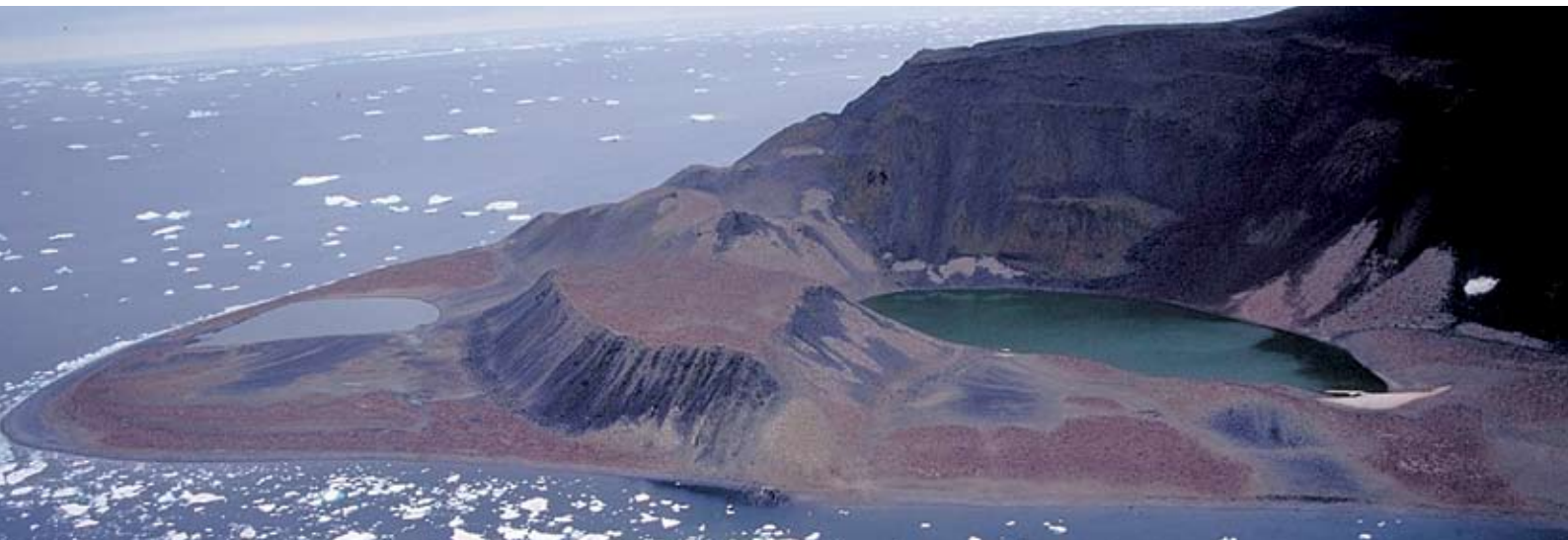
Ile Paulet vue d'en haut

Restez éloigné des talus d'éboulis meubles et ne vous hasardez pas à marcher sur eux. Assurez la protection du site et monument historiques. Restez à un mètre au moins des murs de la cabane car piétiner juste à côté des murs meubles risque de causer des dommages.